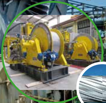
Winches & cables de acero