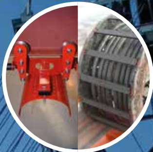
Carros & cadenas portacables