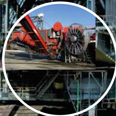
Maquinaria para la minería